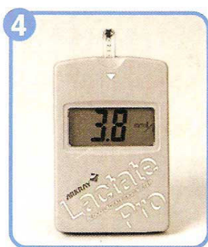
Determinación en 60 seg.