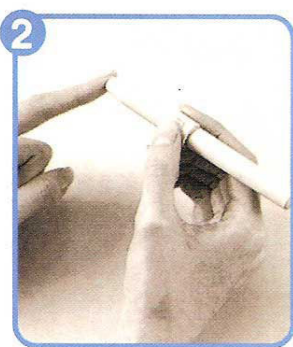
Extraer la sangre