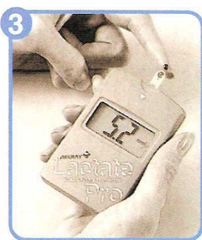
Situar la sangre en la tira